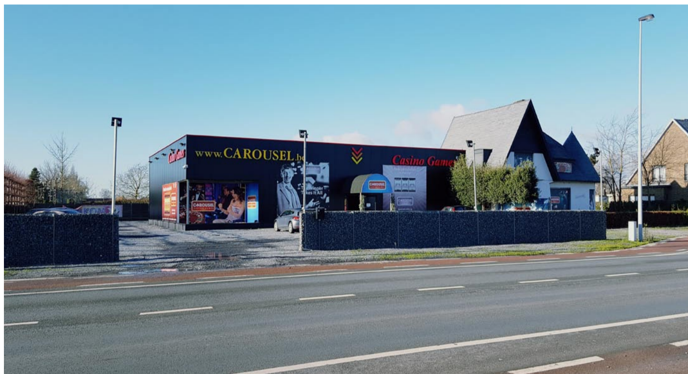
De situatie in 2018